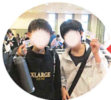
仮運転免許証が取れました！

青少年育成部会と合同で、宗像警察署、城山中学校、赤間小学校、交通安全協会、赤間小PTAのご協力をいただき、今春自転車通学を予定している新7年生を対象に「自転車交通安全教室」を開催しました。 参加した88人は、城山中学校から手渡された仮運転免許証に目を輝かせ、一足先に中学生になったようです。 子どもたちは地域の宝です。地域全体で成長を温かく見守っていきましよう！