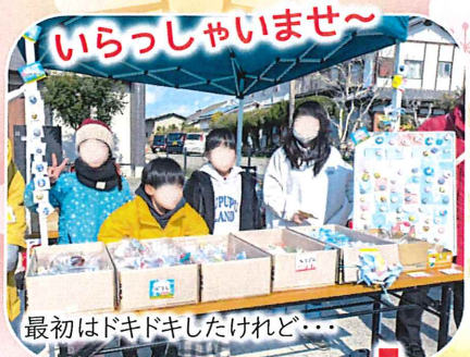
最初はドキドキしたけれど...

今回の販売はもちろ ん、販売する小物の製 作には保護者の方の協 力もあり、たくさん の小物を販売するこ とができました。 お客さんの中には他 の学童の支援員をして いる方や4月から1年 生で入所してくる子 が