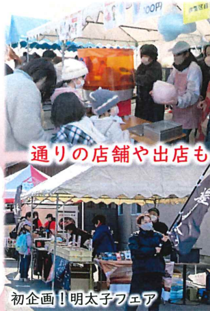
通りの店舗や出店も2日間にぎわいました