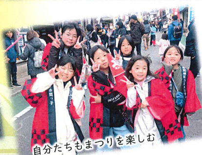
自分たちもまつりを楽しむ