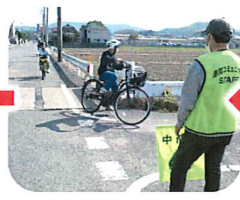
地域の方に見守られながら、公道走行体験