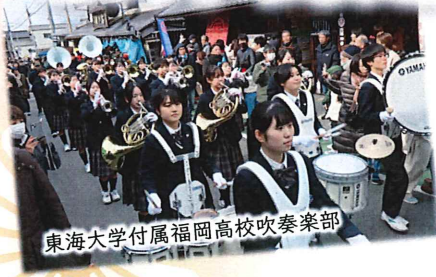
東海大学付属福岡高校吹奏楽部