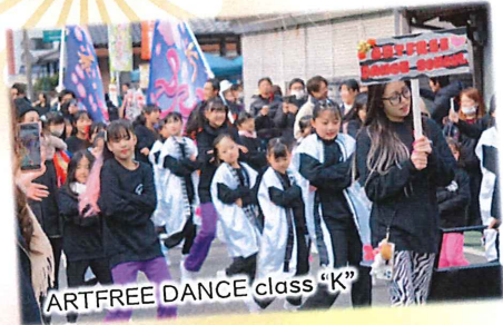
ARTFREE DANCE class "K"