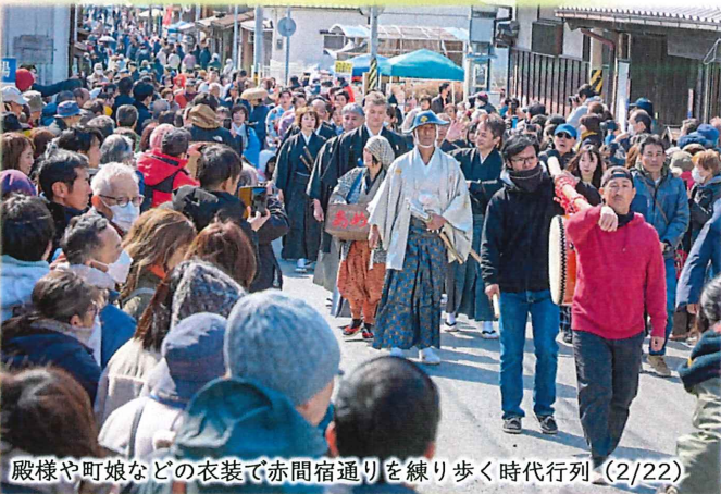
殿様や町娘などの衣装で赤間宿通りを練り歩く時代行列(2/22)

皆さまのご協力の下 25回目の唐津街道赤間宿まつりを盛大に開催することができました。 オープンングパレードは寒い中にもかかわらず、子どもたちの熱気は街道を盛り上げ、輝く赤間っ子のガイドは大好評でした。 また、たくさんのお店では「おもてなしの心」で来訪者を迎え、訪れた人々も大満足のようでした。 赤間地区の皆さまには多大なご協力をいただき、ありがとうございました。 皆さまのおかげで最高のお祭りとなりました。 本当にありがとうございます。 (まつり実行委員会 会長梅田)