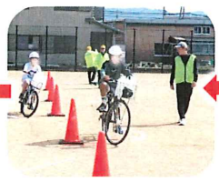
荷台に6リットルの水を載せて、荷重運転体験