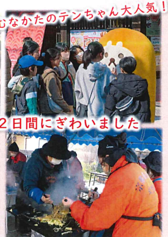
むなかたのテんちゃん大人気!