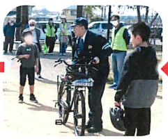
宗像警察署の方から、自転車の点検と交通ルールを教わる