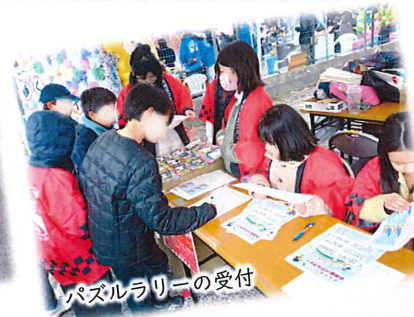
パズルラリーの受付