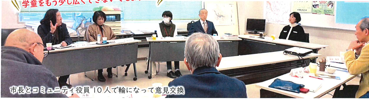
市長とコミュニティ役員 10 人で輪になって意見交換