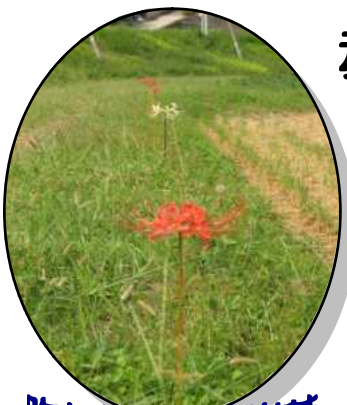
昨年植えた彼岸花