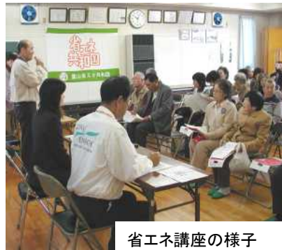
省エネ講座の様子

得ました。赤間地区内で省エネや健康問題の活動が全国大会に出場でき大きな評価を受けたことは大変うれしいことです。