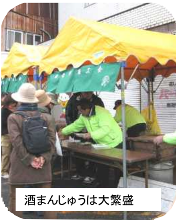
酒まんじゅうは大繁盛

区長会では、80人のスタッフで、餅つきを行い、おろし餅の振る舞いに、大勢の人が列を作つてにぎわいました。 各自治区に協力していただいた、農産物、おでん、豚汁等の出店は大好評！毎年恒例、福岡教育大学生によるお好み焼きも、楽しみの一つです。 商工会赤間地区によるこだわりの酒まんじゅうは、勝屋酒造の酒粕を使用し、試行錯誤を繰り返し、手づくり販売。大好評で、午前中で売切れてしまつたらしい誤算です。新たな赤間宿特産品となるか 旧家開放では、出光佐三生家、石松寛次宅を公開、100年以上赤間宿を見守ってきた旧建物も今日は生き生きと喜んでい