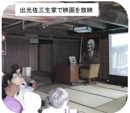
出光佐三生家で映画を放映

区長会では、80人のスタッフで、餅つきを行い、おろし餅の振る舞いに、大勢の人が列を作つてにぎわいました。 各自治区に協力していただいた、農産物、おでん、豚汁等の出店は大好評！毎年恒例、福岡教育大学生によるお好み焼きも、楽しみの一つです。 商工会赤間地区によるこだわりの酒まんじゅうは、勝屋酒造の酒粕を使用し、試行錯誤を繰り返し、手づくり販売。大好評で、午前中で売切れてしまつたらしい誤算です。新たな赤間宿特産品となるか 旧家開放では、出光佐三生家、石松寛次宅を公開、100年以上赤間宿を見守ってきた旧建物も今日は生き生きと喜んでい