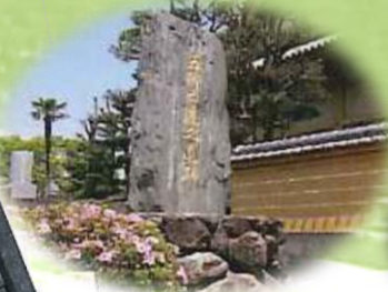
五郷西遷の記念碑